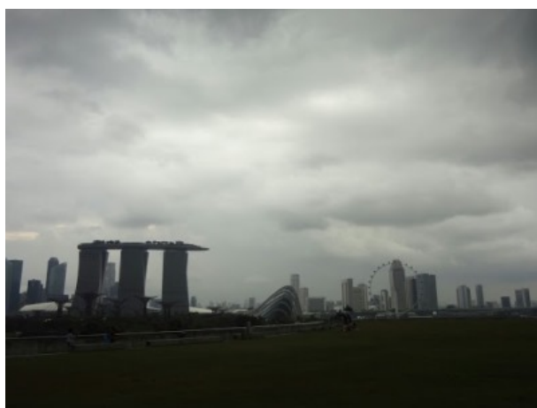
(マリーナベイ・サンズなど有名な施設を見渡せる広場)

Marina Barrage のビジターセンターは上から見ると、貝殻のような形をしている。2階層の構造で、飲食が取れるお店もあり、マリーナ地区の水に纏わる歴史や、この Marina Barrage の取り組みなどを紹介したギャラリーなどがある。天井は芝生で覆われ、そこから、マリーナ・ベイ・サンズホテルや、シンガポールフライヤーなど、人気の観光スポットを一望することができ、非常に景観がよい場所である。子供ずれの家族がピクニックをしたり、ペットと一緒に遊んだりできる憩いの場であり、とても賑わっている。下はその写真であるが、天気が悪く、とてもどんよりとしているが、快晴の日にはきっともっときれいなはず・・・！また、夜景ならもっともっときれいなはず・・・！また行きたくなる場所であった。