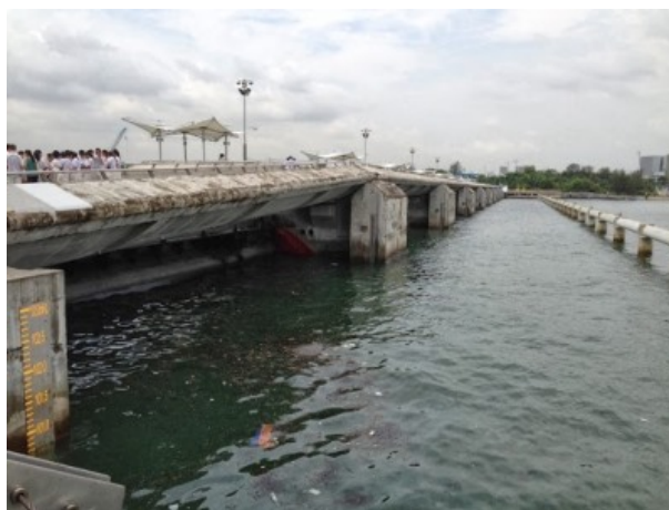
(実際見学した9つのゲートと巨大ポンプ)

Marina Barrage とはマリーナ東と南の間マリーナ海峡、5川の合流点に構築されたシンガポールのダムのことであり、海水が入らないように350メートルの広いマリーナ海峡に構築している。またシンガポールの第15番目の貯水池でもある。マリーナ貯水池は、2011年にはパハン、セラングール貯水池も合流させ、シンガポールの国土面積の3分の2の半分からシンガポールの集水域を増加させた。2010年11月20日には、今後の世代のためにシンガポールの水の供給を増強し、淡水リザーバーとして、元首相メンター・リー・クアンユー委嘱された。脱塩は、雨水による自然交換を通じて、2009年4月に始まり、地元の流域水は、他の3水、ニューウォーターと脱塩水をインポートされ、地元の水供給の柱の一つとして、マリーナ貯水池は、シンガポールの現在の水需要の約10%を満たすことができている。