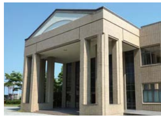
メディアセンター (図書館)