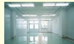
試作開発室タイプ