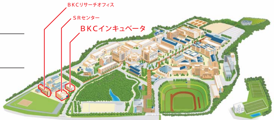
立命館大学びわこ・くさつキャンパス